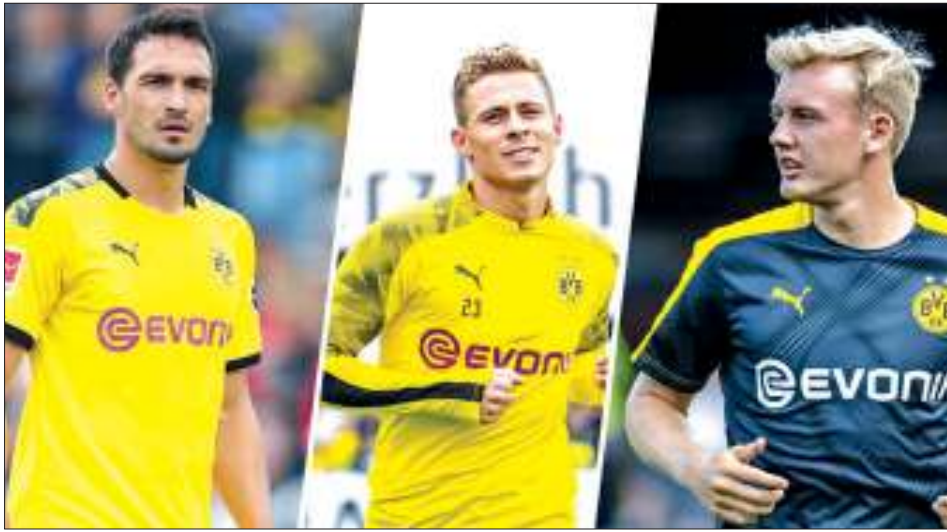
(əvvəli ötən sayımızda)

Almaniya Bundesliqası 2019-2020-ci illər yay transfer pəncərəsində bir sıra futbolçuların keçidini rəsmiləşdirdi. Digər ölkələrdən fərqli olaraq alman klubları ölkə hüdudlarından kənar çıxış edən az sayda futbolçunun transferini həyata keçirdi. Bundesliqada çıxış edən klublar daha çox öz aralarında futbolçuların "dəyişdirilməsinə" nail oldular. Avropanın nəhəng klubları sırasında yer alan "Bavariya" bu dəfə elə də fəallıq nümayiş etdirmədi. Halbuki, ötən mövsümün sonunda komandanın heyətində yer alan aparıcı futbolçular klubu tərk etmişdilər. Onların yerini doldurmaq üçün "pivəçilər" bəlkə də pullarına qənaət etdilər. Yaxud həmin yeni futbolçularsız da "Bavariya" hazırkı mövsümdə ardıcıl çempionluğu təmin etmək, Çempionlar Liqasında əsas mükafata sahib olmaq niyyətindədir. Bu hər halda klubun "gizli siyasəti"nin görünməyən tərəfləridir. Hər halda bu il "Bavariya" transferlərə cəmi 143,50 milyon avro xərcləyib. Klubun builki uğurlu transferləri Lukas Hernandez, Benjamin Pavard, Flipe Koutinyo, İvan Perişç sayılır.