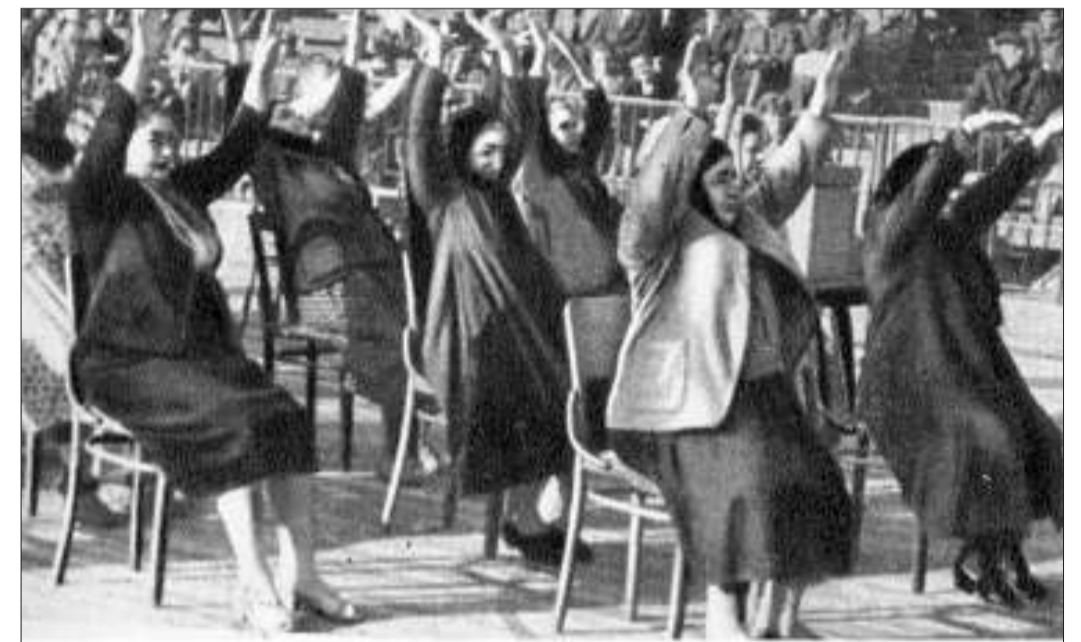
Bakı şəhərinin «Sağlamlıq zonası»nda idman gimnastikası (1960)