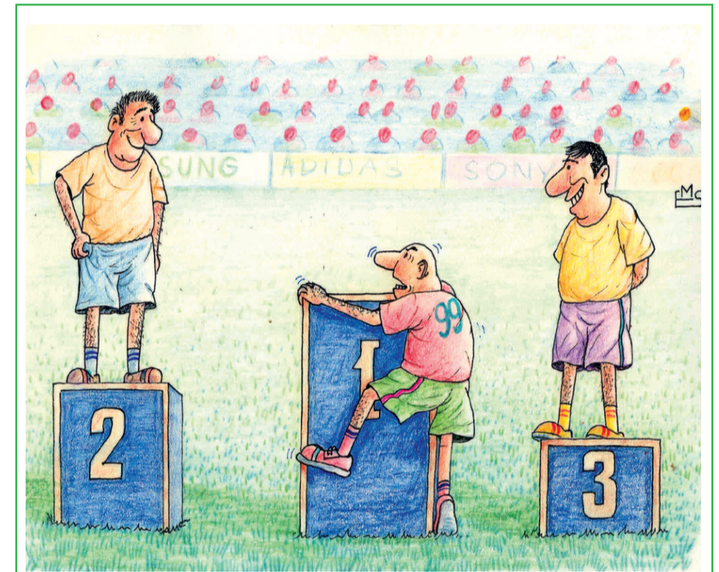
(“Olimpiya dünyası” qəzetinin keçirdiyi I Bakı Beynəlxalq Karikatura Müsabiqəsindən)

Qalib idmançının adı fevral ayının 21-də Monakoda açıqlanacaq.